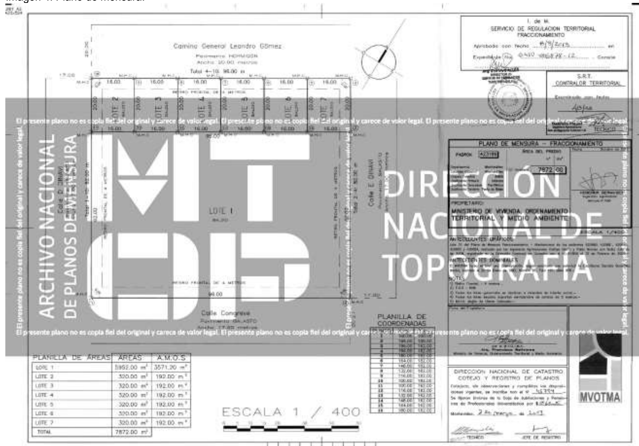
Imagen 4: Plano de mensura.