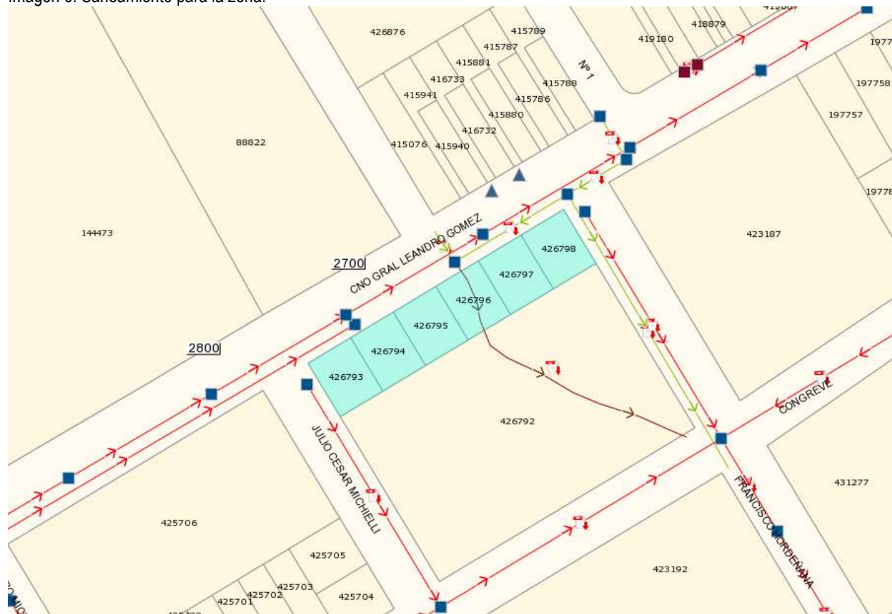
Imagen 6: Saneamiento para la zona.