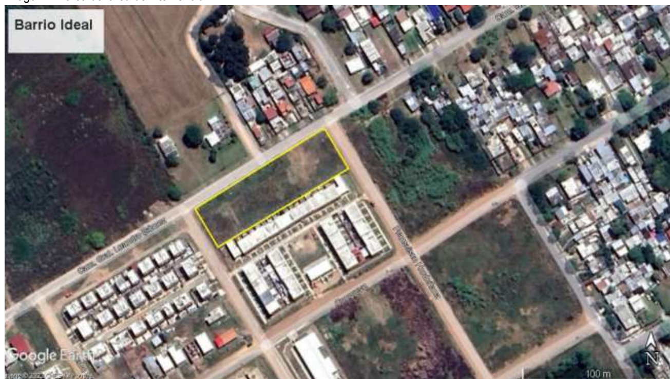
Imagen 1: Aérea del área de intervención.